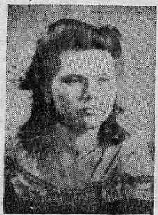
STA. ROSA CASTANEDA